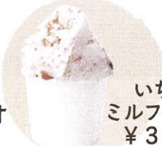
いちご ミルフィーユ ¥380

ピスタチオがたっぷり、豆の甘さが上品なプレミアムジェラート。鼻から抜ける香ばしい匂いも楽しめます。